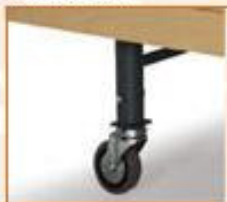
PATA CON RUEDA